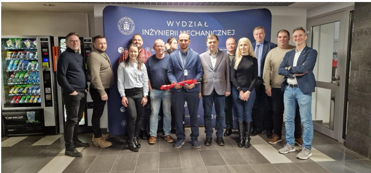
Participanții la întâlnirea transnațională de lucru TPM (Polonia)

Au fost menționate, de asemenea, activitățile și evenimentele proiectului, precum și rezultatele principale și indicatorii care trebuie obținuți la finalul proiectului. Au fost menționate și activitățile și evenimentele ce trebuie organizate în cadrul proiectului, precum și rezultatele așteptate vizavi de aceste evenimente.